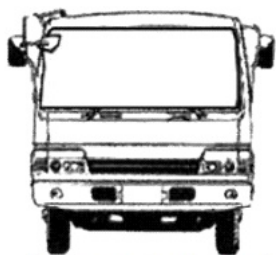
ゲートヘコミ・キズ・サビ